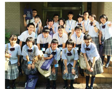
この中から未来のノーベル賞受賞者が!??