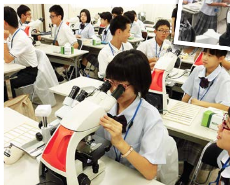
生物顕微鏡で土の粒子を観察