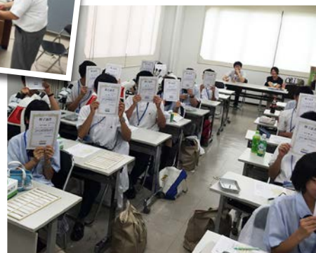
参加者全員に「未来博士号」が贈られました